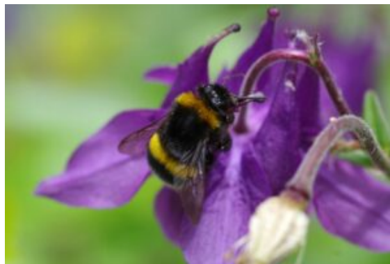
Akelei mit Hummel Akelei

Im Frühjahr ist der große Auftritt der Zwiebelpflanzen: Krokusse, Blausterne und Winterlinge stellen schon früh im Jahr Nektar und Pollen für Hummeln und Bienen bereit. Lungenkraut, Himmelschlüsselchen, Akelei und kriechender Günsel (Bodendecker) folgen.