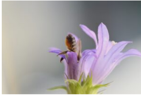
Glockenblume mit Bienenpo

Im Herbst sind besonders Fetthenne ( Sedum telephnium ), Astern und die Besenheide ( Calluna vulgaris ) eine gute Nahrungsquelle.